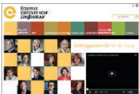
Website voor Erasmus Centrum voor Zorgbestuur