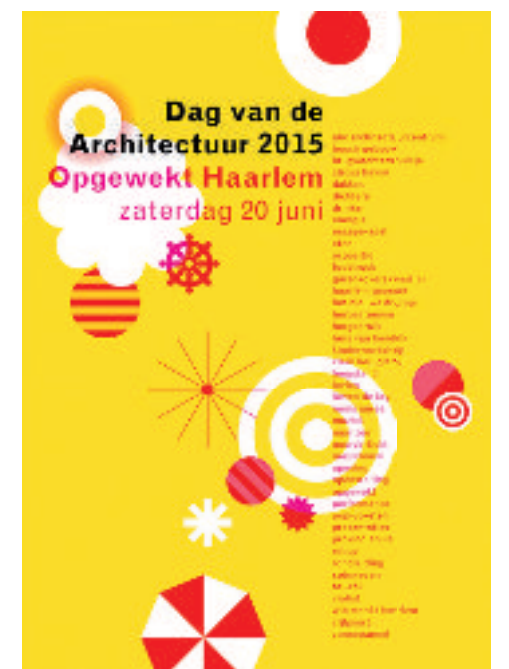
Vouwblad voor het programma van de Dag van de Architectuur 2015 in Haarlem