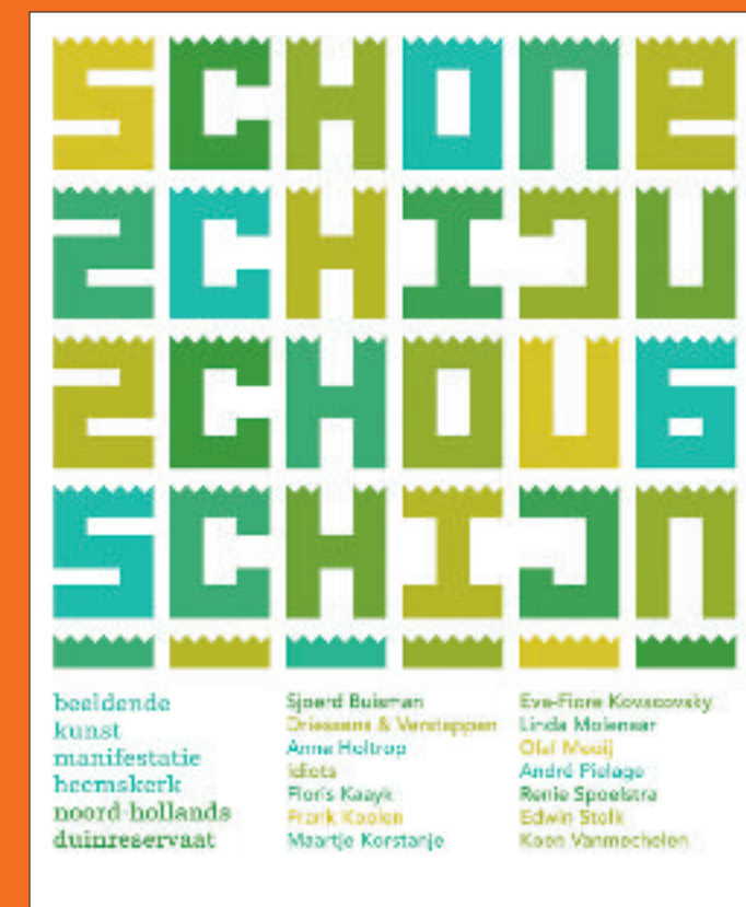
Diverse letterontwerpen, deels geïnspireerd op dieren