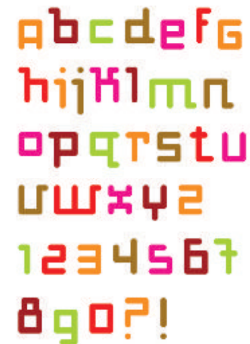
Letterontwerp Urban Type voor de beursstand Urban Design